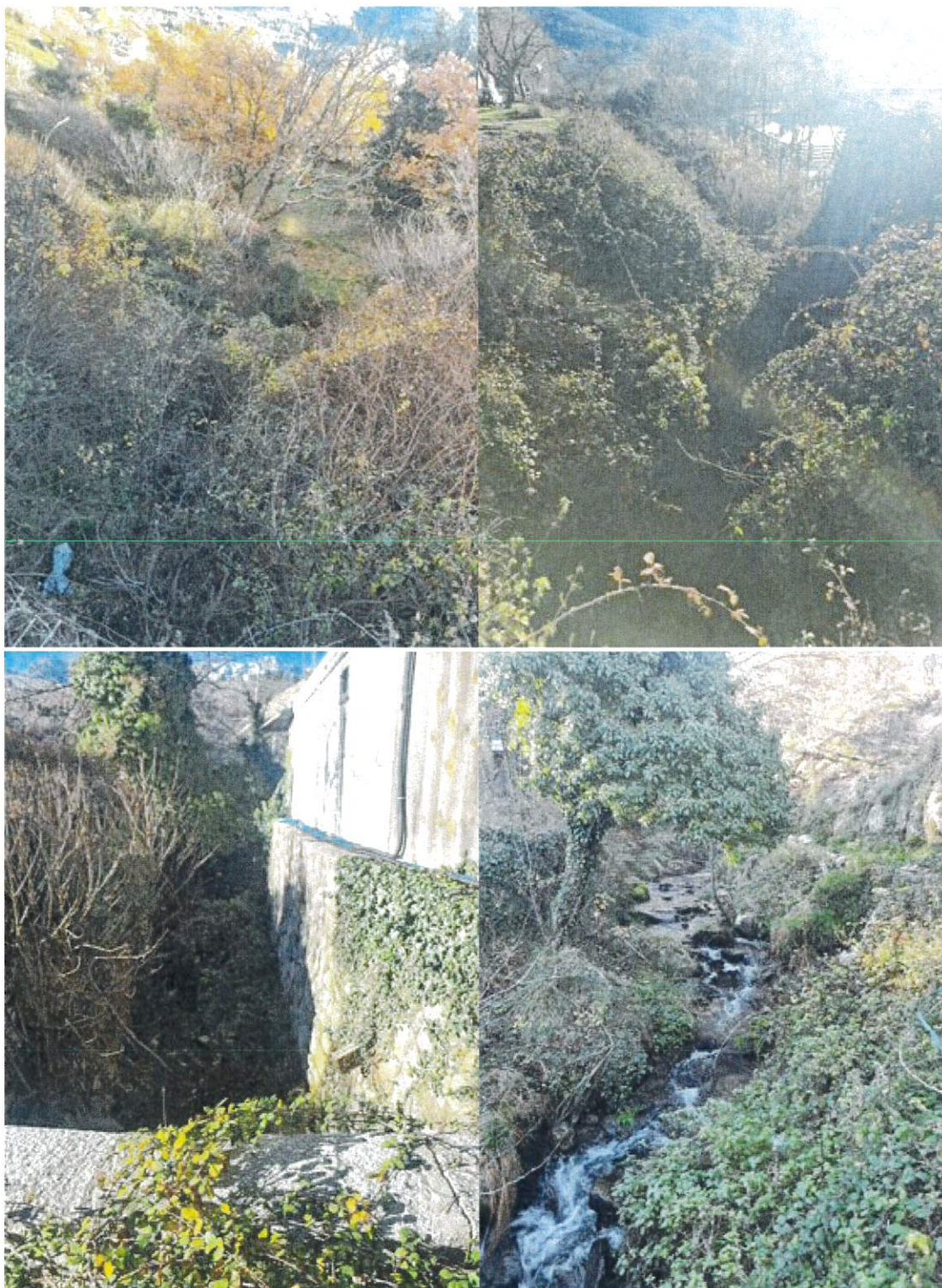
Figure 2: Photographies ruisseau 1