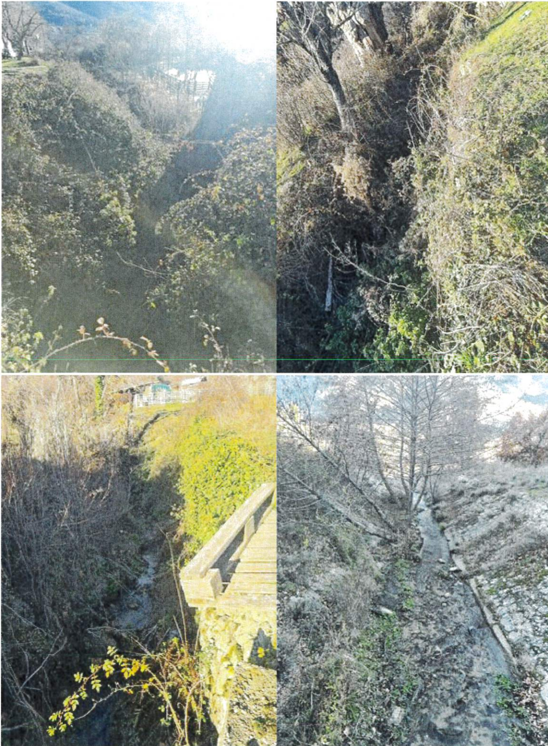
Figure 3: Photographies ruisseau 2